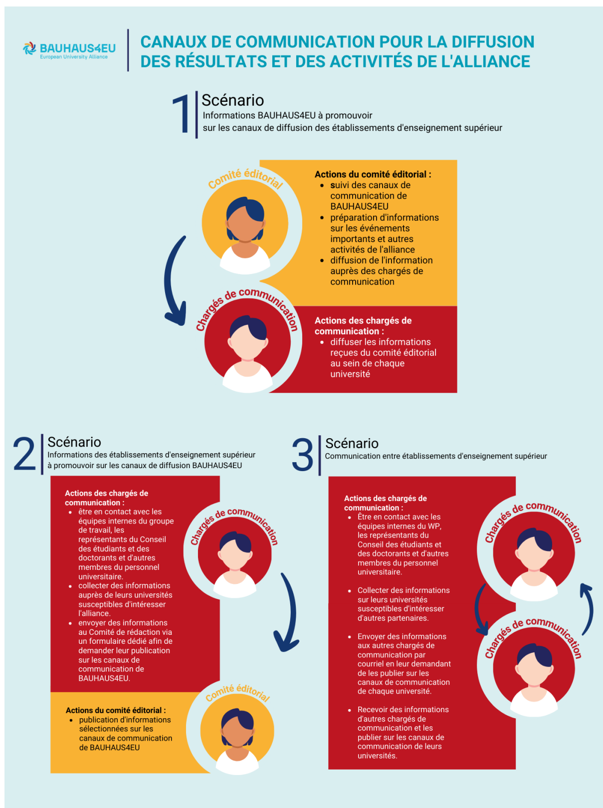
Image 3 : Voies de communication pour la dissémination des résultats et des activités de l'Alliance entre et au sein des institutions BAUHAUS4EU

Cette approche structure permet un échange d'informations efficace et garantit une communication cohérente, régulière et efficace au sein de l'Alliance.